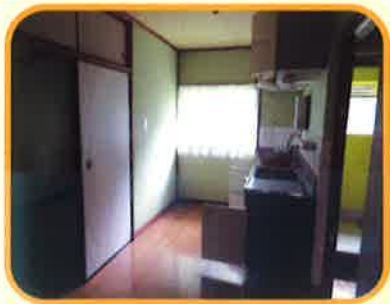
職員住宅完備！ 家賃 月7,320円 光熱水費別